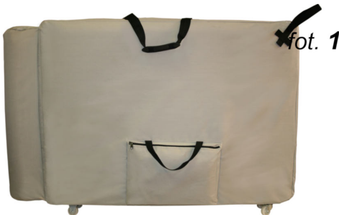
"A" kółka tylne