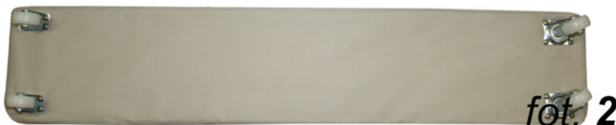
"B" Kółka przednie (skrętne)

Kółka należy przykręcić śrubami dołączonymi do zestawu (16sztuk, po 4 śruby do jednego kółka) śrubokrętem krzyżakowym. Kółka tylne "A" (nie-skrętne) po stronie kieszeni na walek, kółka przednie "B" (skrętne) po stronie uchwyty do ciągnięcia. Kółka należy przykręcić zgodnie ze zdjęciem numer 2 zachowując conajmniej centymetr odstępu od brzegu deski.